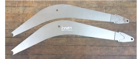
CNC-gefräste Seitenteile eines Monoblock Auslegers für einen RC Bagger

Dann zögern Sie nicht und kontaktieren mich, ich helfe Ihnen gerne dabei Ihre Ideen für Sie umzusetzen.