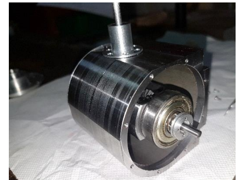
Eigens konstruiertes sowie gefertigtes Differenzial mit Sperre für ein RC -Kommunalfahrzeug