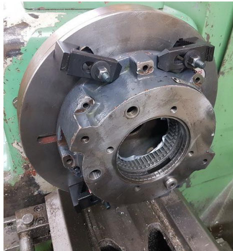
Revision einer Schwenkbremse für einen O&K Bagger