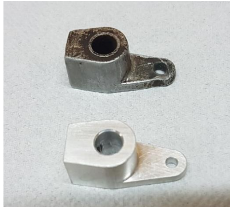
Vergaseranlenkung Rapid-Einachser Motor